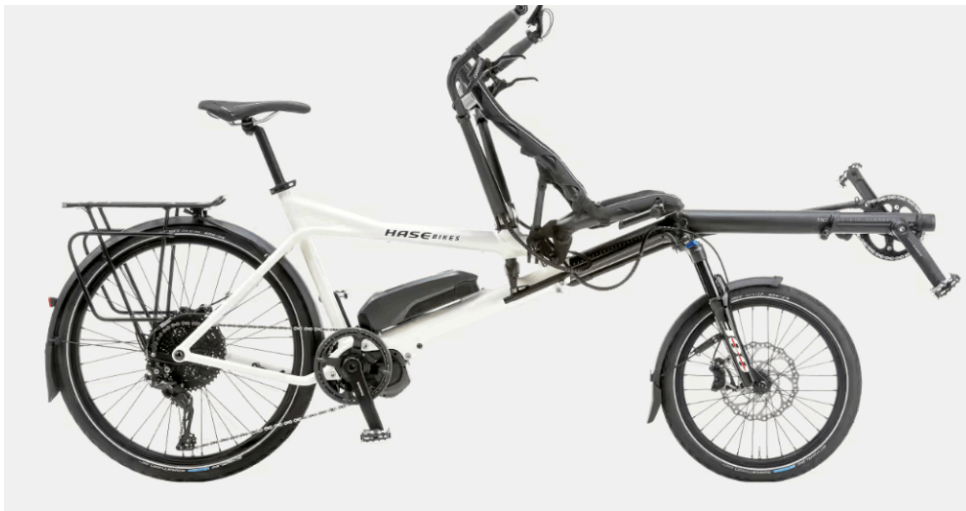
Tandem Pino STEPS – Hase Bikes