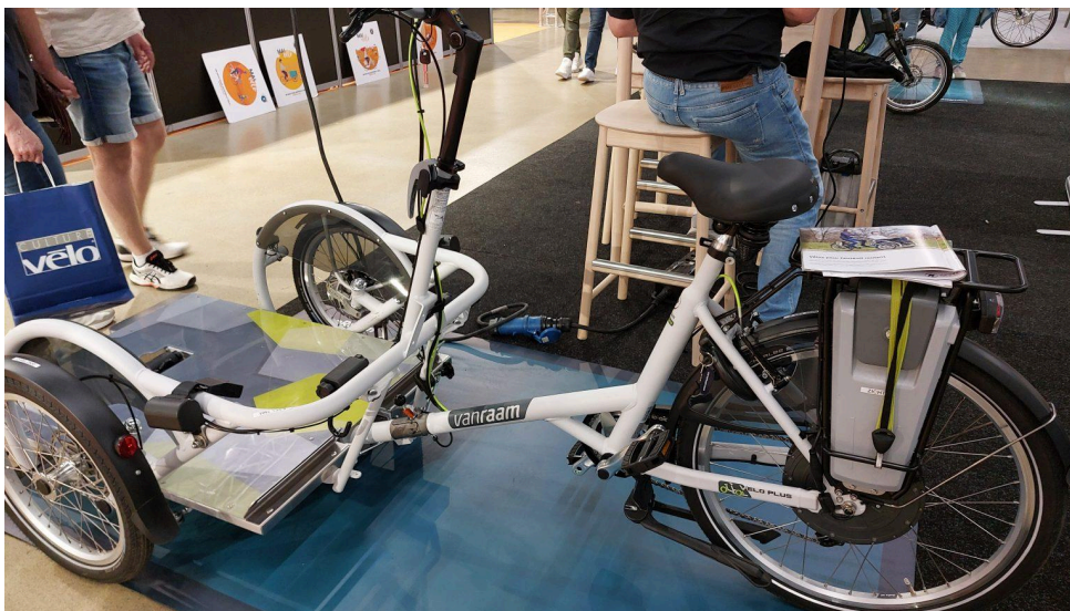
Vélo Fauteuil VeloPlus – Van Raam

Le secteur du vélo adapté propose aujourd'hui une palette de solutions techniques, permettant de répondre à des besoins variés, qu'il s'agisse de handicaps moteurs, sensoriels ou cognitifs. Les innovations et les modèles exposés lors du salon Vélo in Paris 2025 illustrent la variété et la spécificité des solutions proposées.