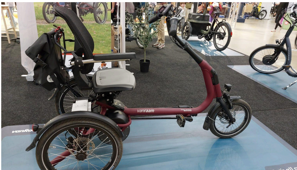
Tricycle Compact « Easy Rider » – Van Raam

Les personnes malvoyantes ou non-voyantes peuvent pratiquer du vélo grâce à la conception des tandems adaptés. Le tandem Pino, développé par la société HaseBikes ( https://www.hasebikes.com/kategorie/tandem/alle-tandems ) il y a de cela 25 ans, est conçu pour permettre à un pilote voyant de guider une personne déficiente visuelle, tout en offrant un confort optimal et une communication aisée entre les deux cyclistes. Certaines innovations récentes intègrent des dispositifs sonores ou vibrants pour signaler la proximité d'obstacles, renforçant ainsi la sécurité et l'autonomie des utilisateurs.